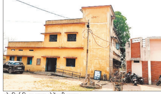
नोनबिरा स्थित हायर सेकेंडरी स्कूल।

जिले में माध्यमिक शिक्षा मंडल द्वारा ली जा रही 10वीं 12वीं ओपन परीक्षा के लिए कुल 12 परीक्षा केन्द्र बनाए गए हैं। इन केन्द्रों में नकल की शिकायतें