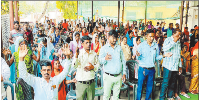
प्रार्थना करते मसीही समुदाय के लोग।