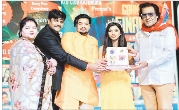
विजेता प्रतिभागी को पुरस्कृत करते अतिथि।

बिगोस्ट ब्यूटी पिंगमेंट 2024 का आयोजन होटल सेंटर पाईट में आयोजित किया गया। जिसमें