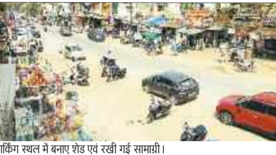
पार्किंग स्थल में बनाए शेड एवं रखी गई सामाग्री।

कटघोरा के बस स्टैंड के व्यवसायियों द्वारा वाहन पार्किंग स्थल में ही अपने शेड बनाने और प्रचार सामाग्री लगा देने से आम लोगों को जहां व्यवहारिक कठिनाईयों का सामना करना पड़ रहा है तो वहीं दूसरी ओर चौड़ी सड़क भी अब धीरे-धीरे सक्रिय